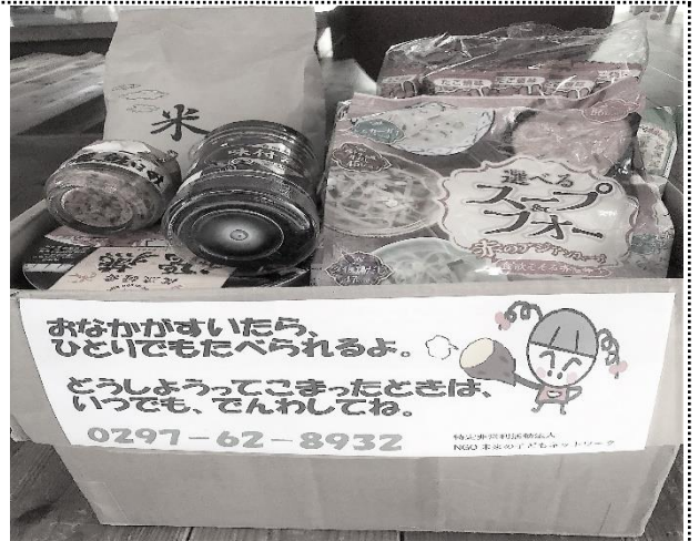
(みらサポ「子ども食堂」食宅配箱詰め例)

クリスマスは嫌いだ！と言う子がいた。 「お金持ちの家にはしかサンタは、行かないから」 (親がサンタだとは、まだ知らないんだよね。)