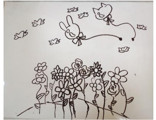
(阿見いばきら塾スタッフ K・H)

「あのね学校でね…」とか「今日家でね」等、子ども達が心の声を聞かせてくれる事もあって、とても貴重な時間となっています。そんな時間を共有して下さる方大募集中です！