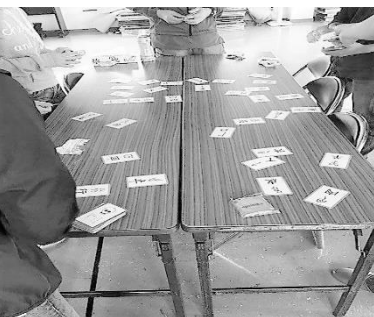
(美浦いばきら塾スタッフ C・M)

そして、休憩時間は子どもたち学習カルタをしに集まってきます。「歴史年号カルタ」「四字熟語カルタ」「ことわざカルタ」「歴史人物カルタ」CDから英語が流れてくる「英語カルタ」などいろんなカルタをそろえています。「学習は集中すればするほど、気分転換も必要だよ～」そんな子どもたちの声が聞こえて来ますが、実は子どもたち、とても手が早くとても成績が良いのです。おとなもいつも負けてはいられません(笑) 休憩時間の遊びの中にも、少しでも学習に役立つように。。。とスタッフの意図がありありですが(笑) みなさん毎回とても盛り上がり、楽しみのひとつとなっているようです。