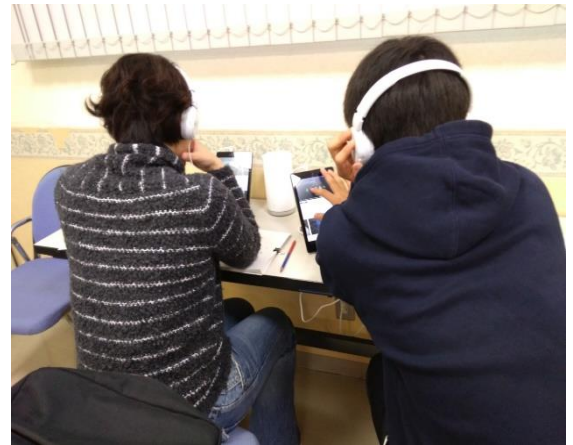
いばきら塾・阿見スタッフ K

そんな背中を見ているから？か、気分転換のスペースが小さくなってしまっても、小学生達からは苦情もありません。がんばっている姿が自然と視界に入る、というのも、学習に対する「姿勢」を学ぶ良い機会になっているのかな、なんて勝手に思っています。