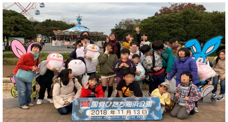
参加人数子ども20名 ボランティアスタッフ8名

云いたい放題にしている事やその他子ども対応に？を感じられる方もいるかもです。どうしてそうしているのか？いつか、この居場所の考え方を説明できればと思います。