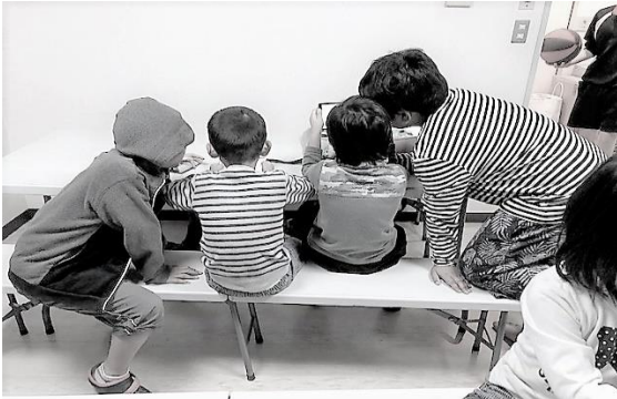
何を皆でのぞいているのかな？

だけど、そんな暴言の中、不図気づくと何年も髪の毛で目を隠していた子、マスクを外せなかった子…が、髪の毛ちゃんと切ってるしい、マスクしないでいるしい、マスク外せる様になるのに5年長かった時間、数知れない暴言群・・・が綺麗に消えていく。良かった一先ず、前に歩き出した。